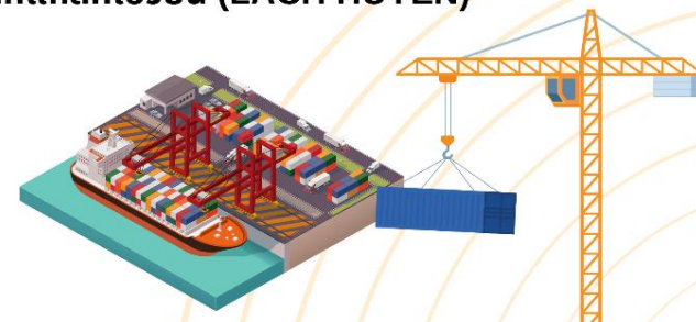
THE CONTAINER PORT PERFORMANCE INDEX