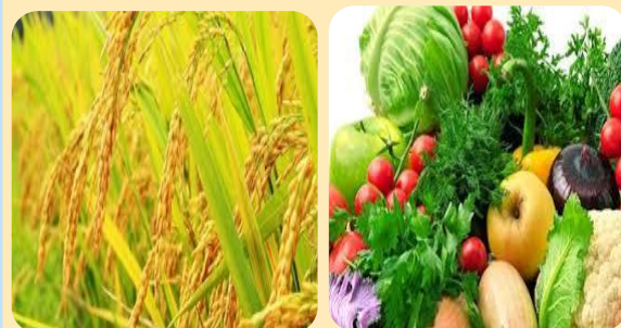
ข้าวเปลือกเจ้า