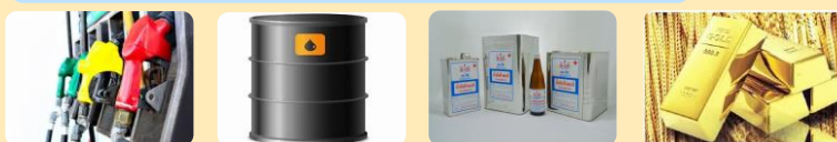
น้ำมันเบนซิน ดีเซล น้ำมันเตา น้ำมันก๊าด และทองคำ