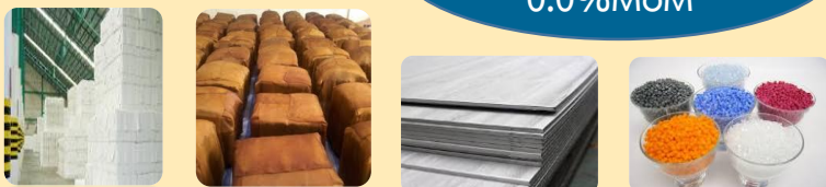
เยื่อกระดาษ ยางแผ่นยางแท่ง เหล็กแผ่นเหล็กเส้น เม็ดพลาสติก