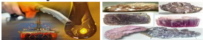
น้ำมันปิโตรเลียมดิบ