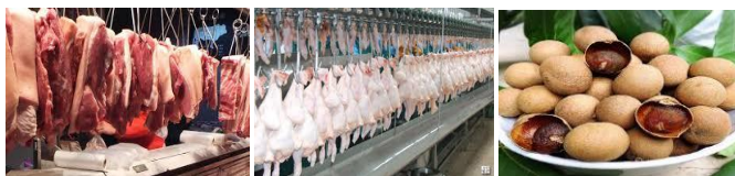
เนื้อสุกร