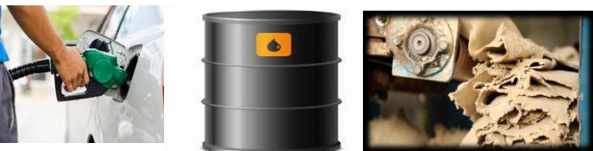
น้ำมันเบนซิน