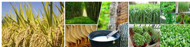
ข้าวเปลือก