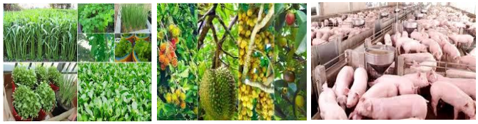
พืชผัก ผลไม้ สุกรมีชีวิต