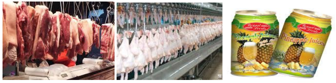
เนื้อสุกร ไก่สด ข้าวสาร สับปะรดกระป๋อง