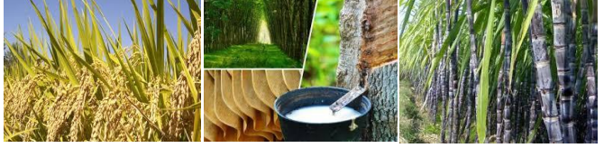
ข้าวเปลือก ยางพารา อ้อย