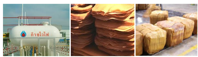
ก๊าซปิโตรเลียมเหลว (LPG) ยางแผ่น/ยางแท่ง