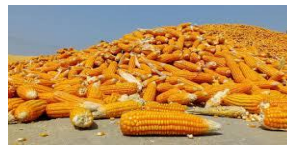
ข้าวโพดเลี้ยงสัตว์