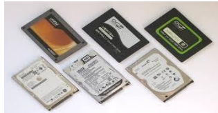
ฮาร์ดดิสก์