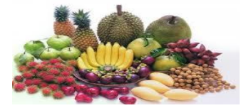
ผลไม้ (องุ่น กล้วยน้ำว้า สับปะรดโรงงาน ฝรั่ง)