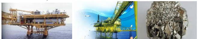
น้ำมันปิโตรเลียมดิบ