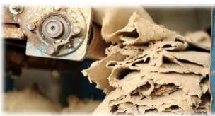
เยื่อกระดาษ