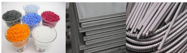
กลุ่มเคมีภัณฑ์ (เม็ดพลาสติก)

กลุ่มน้ำมันเชื้อเพลิง น้ำมันเบนซิน น้ำมันดีเซลหมุนเร็ว น้ำมันเตา น้ำมันก๊าด และก๊าซปิโตรเลียมเหลว (LPG)