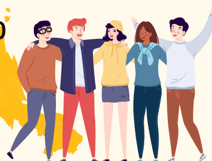
อนาคต โดยรวม ปัจจุบัน