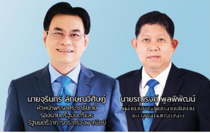
นายจรินทร์ ลักษณวิศิษฏ์ หัวหน้าพรรคประชาธิปัตย์ รองนายกรัฐมนตรีและ รัฐมนตรีว่าการกระทรวงพาณิชย์