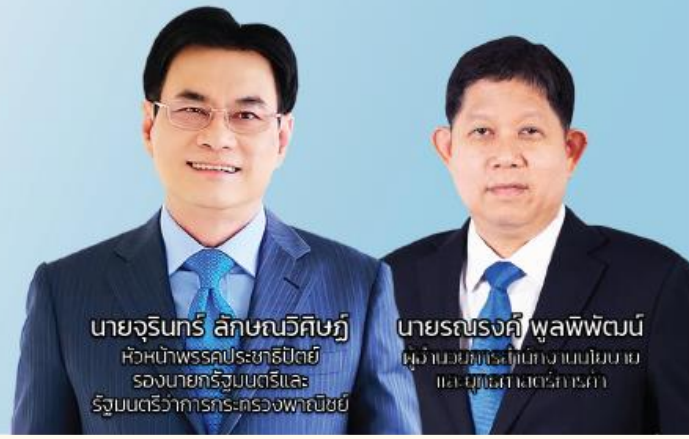
นายจรินทร์ ลักษณวิศิษฏ์ หัวหน้าพรรคประชาธิปัตย์ รองนายกรัฐมนตรีและ รัฐมนตรีว่าการกระทรวงพาณิชย์