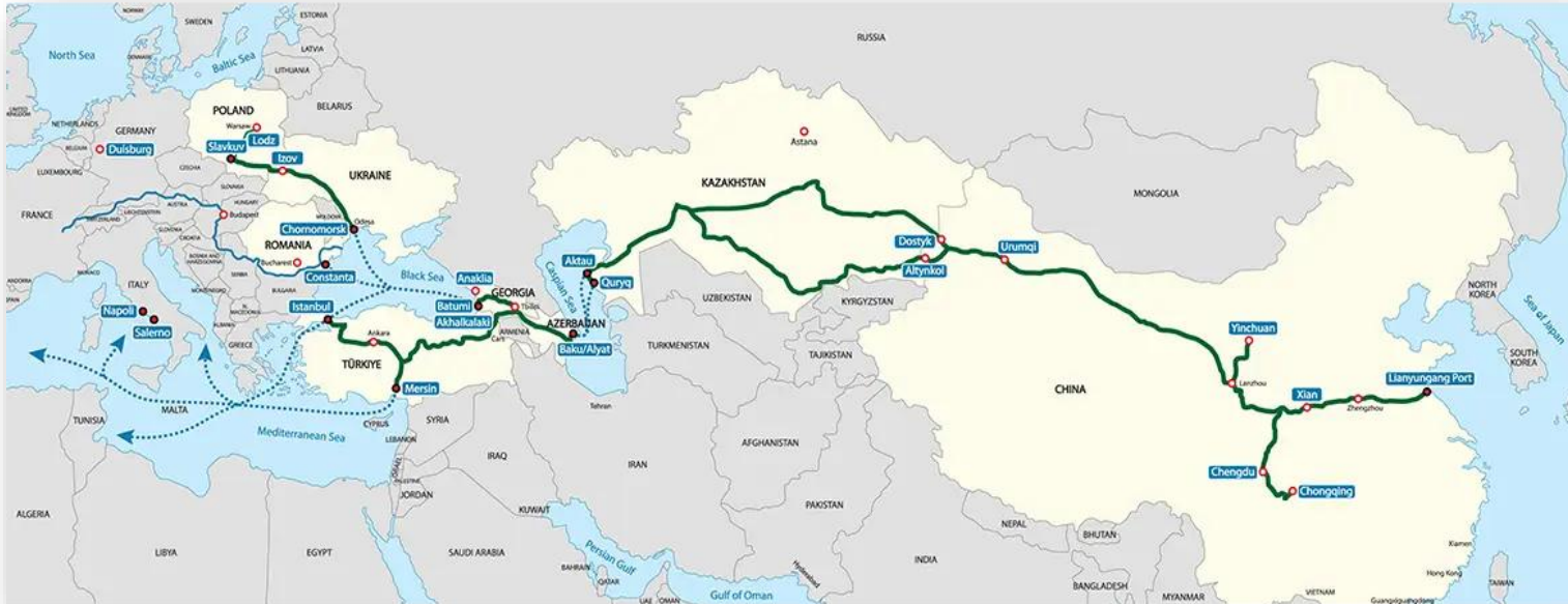
เส้นทาง Middle Corridor (Rusi, 2025)