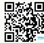
รายงานสถานการณ์เศรษฐกิจการค้าภูมิภาค

หมายเหตุ: 1/ ยอดขายของสถานประกอบการ เป็นตัวเลขยอดขายตามการยื่นแบบ ภ.พ.30 ต่อกรมสรรพากร 2/ รายได้เกษตรกร แบ่งออกเป็น 5 ภูมิภาค ได้แก่ กรุงเทพฯ และปริมณฑล ภาคกลาง ภาคตะวันออกเฉียงเหนือ ภาคเหนือ ภาคตะวันออกเฉียงเหนือ และภาคใต้