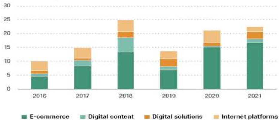
Figure 5. Greenfield investment, 2016 - 2021 (Billions of dollars)

Source: UNCTAD, based on Financial Times Ltd, fDi Markets (www.fdimarkets.com).